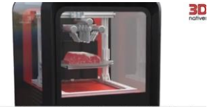
A few months ago, the startup Redefine Meat unveiled its alternative meat 3D printer ...