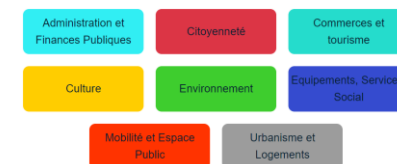
Thèmes open data Paris